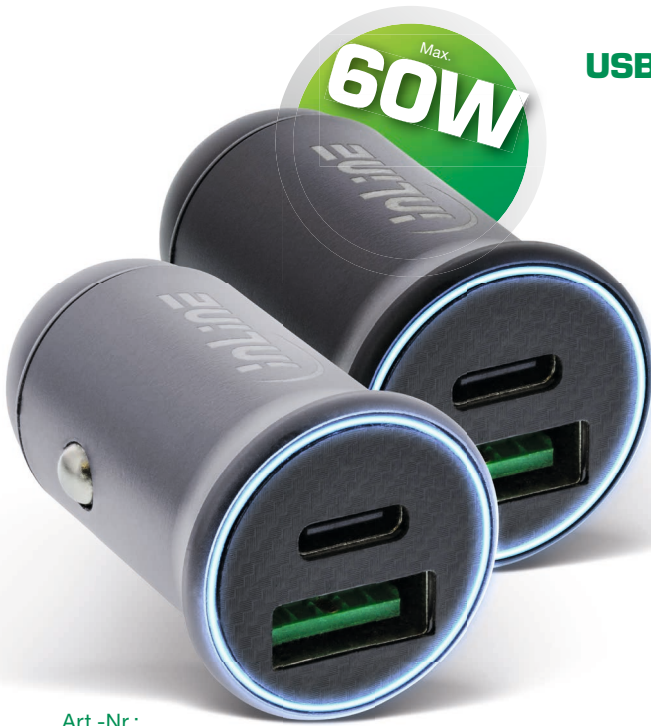
Art.-Nr.: 31502S (schwarz / black) 31502G (grau / grey)