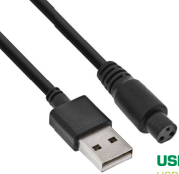
USB zu 3-Pol. Adaptrkabel USB TO 3-PIN ADAPTER CABLE