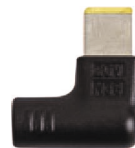
N35: 11x5.6x11mm LENOVO: 20V2.25A