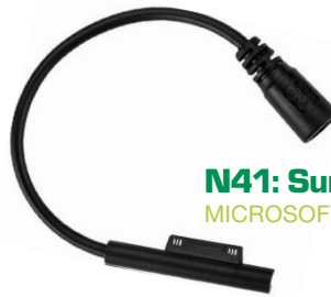
N41: Surface Pro4 12V MICROSOFT: 12V2.58A IC CODE