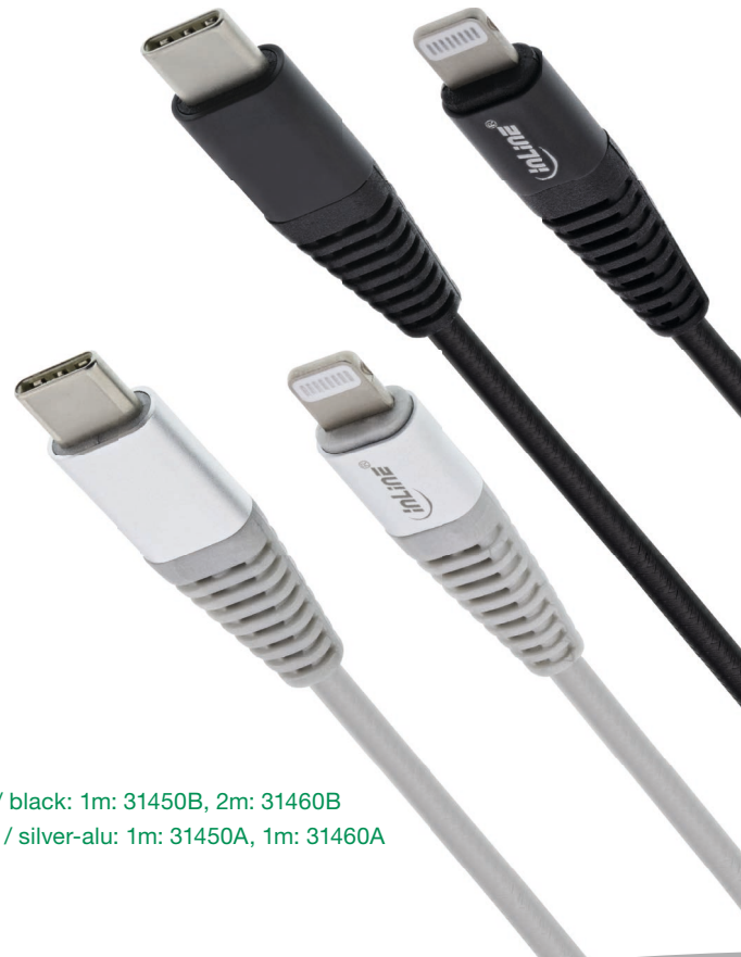
Art.-Nr.: Schwarz / black: 1m: 31450B, 2m: 31460B Silver-Alu / silver-alu: 1m: 31450A, 1m: 31460A