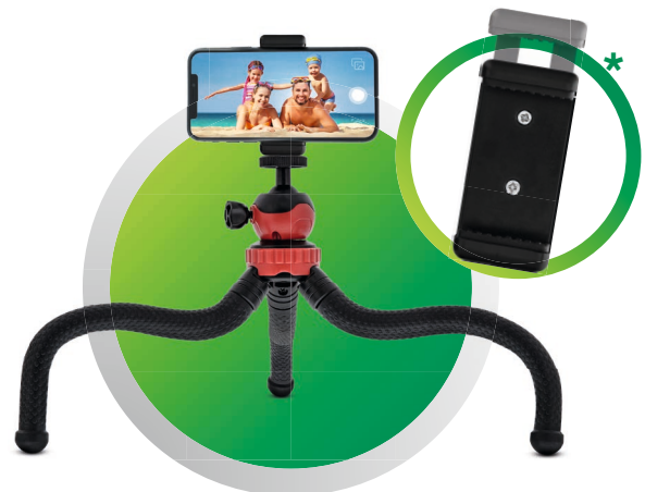
*OPTIONAL: SMARTPHONE-ADAPTER: 48090H