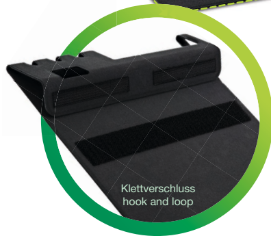
Klettverschluss hook and loop