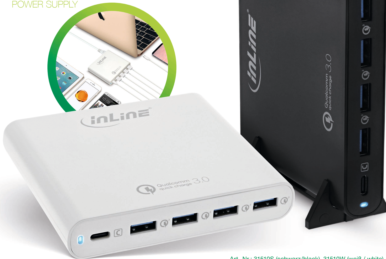
Art.-Nr.: 31510S (schwarz/black), 31510W (weiß / white)

4+1 QUICK CHARGE 3.0 USB NOTEBOOK POWER SUPPLY